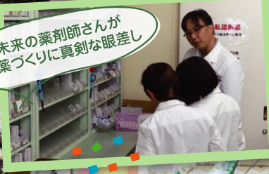
お薬相談・介護相談