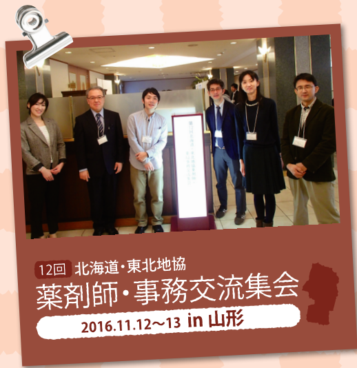
12回 北海道・東北地協 薬剤師・事務交流集会 2016.11.12~13 in 山形