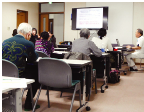
地域健康教室の様子

「健康サポート薬局」とは、かかりつけ薬局・薬剤師としての機能と、地域住民の健康づくりをサポートする機能をもち、国が定めた様々な要件を満たした薬局です。従来の対「患