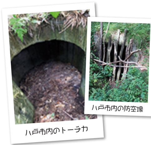
八戸市内の防空壕

一日目は戦時中の八戸市について戦争体験者の方から話を伺い、防空壕、トーチカを案内していただきました。八戸市は陸軍によって飛行場が設置され、海軍が沿岸に配置されるなど、敵軍本土上陸の重要地点とみなされたそうです。コンクリート製弾薬庫